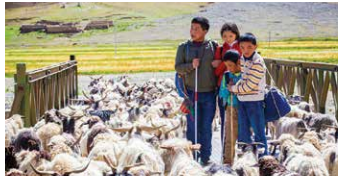
HuaHao Film und Media

> Zu Gast: Regisseurin Stéphane Demoustier (angefragt)